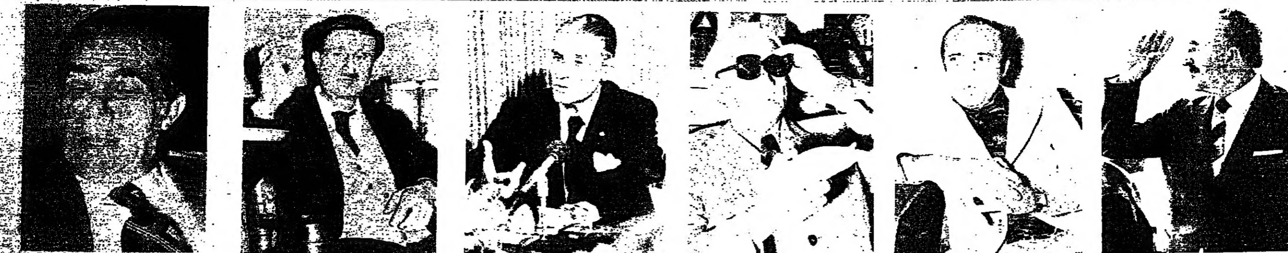
الاسعد : حامل أختام العهد ■ شمسون : لم يقل لئنه بعد ■ جميل : ماذا يكون دوره ؟ ■ جنيلاط : « لا » مبكرة ■ اده : التمهيد يعني التمديد

العديد يرون اده مثلا وهو اول ماروني شهر سيف المعارضة في وجه العهد واحد الطامحين الى ضم بيوها ، ينادي الى التمسك بالثقل السياسي ، والى اعادة اصدار «الولاية» ، وهي الامدات القديمة الأخرى ، كتقت قد وضعت النواب والراي العام ، في اجراء تمسك لهم او تفرس عليهم تقبل وهضم وتصديق